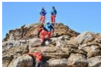
クライミング？皆、若い！