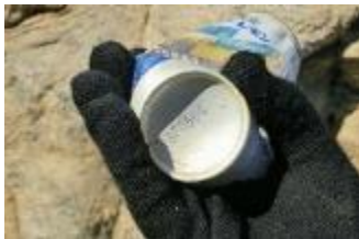
30 年前の空き缶発見