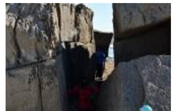
胎内岩をくぐると・・・