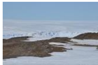
目の前は南極大陸